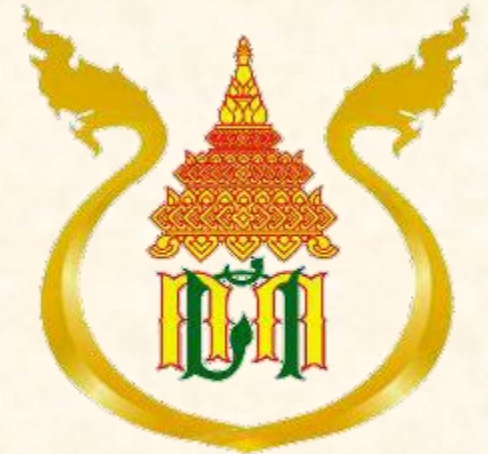
ด้านศุลกากรหนองคาย