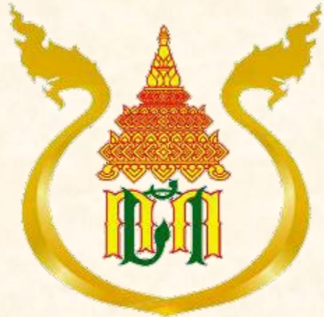
ด้านศุลกากรหนองคาย